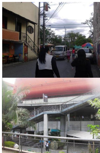
Imagen 3: A la izquierda la salida a la calle 77, frente al Parque Norte. A la derecha el Parque Explora. Se observa las diferencias entre uno y otro sector. El uno sin intervenir, el otro con constante inversión pública. Imágenes tomadas durante la visita al barrio.